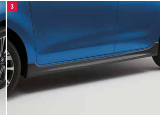
3 | Bočný podspojler WVTA Karbónový dizajn, pre ľavú a pravú stranu. Obj. čís. 99112-53R01-000 C D E