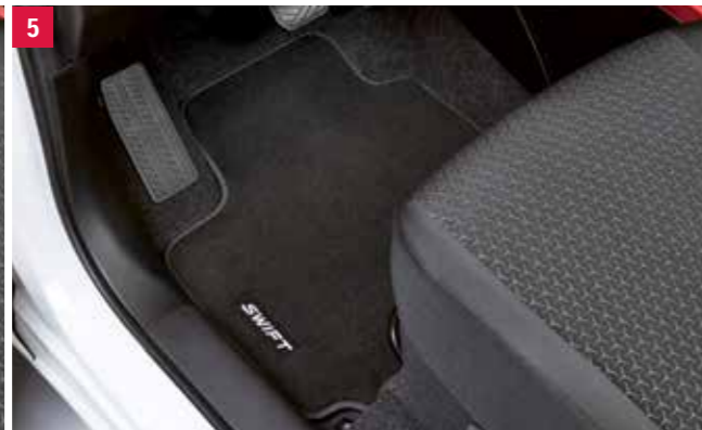
5 | Sada koberčekov „DLX“ 1,2 Antracitové velúrové koberce so strieborným vyšívaným logom a lemovaním Nubuk, štvordielna súprava, pre vozidlá s manuálnou alebo automatickou prevodovkou. Obj. čís. 75901-52RG1-000