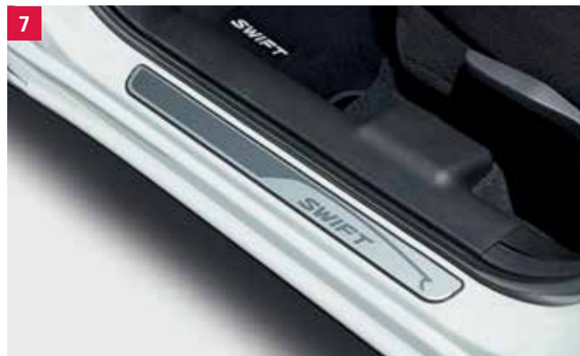
7 | Prahová lišta Saténový povrch z anodizovaného hliníka, štvordielna súprava, s lešteným logom Swift. Obj. čís. 990E0-53R60-000