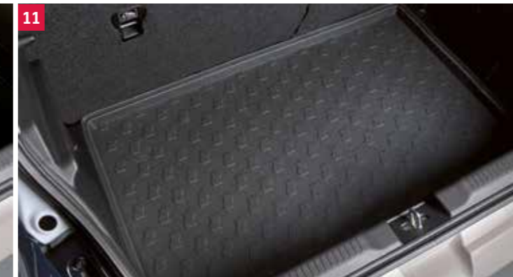
11 | Vanička do batožinového priestoru 3 Vodotesná, so zvýšenými okrajmi. Obj. čís. 990E0-53R15-000