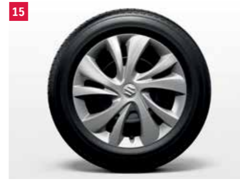
15 | Kryt kola 15“ Strieborný, pre plechový disk 15“, jeden kus. Obj. čís. 43250-52R00-ZH1