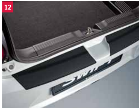
12 | Ochranná fólia pre nárazník Trojdielna súprava fólií na ochranu nárazníka pred poškrábaním. K dispozícii v nasledujúcich verziách: Black Obj. čís. 990E0-53R57-000 Priehľadná Obj. čís. 990E0-53R57-001