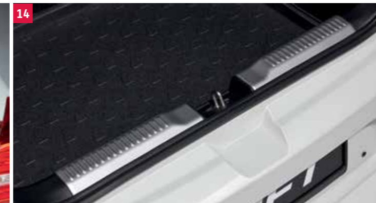
14 | Ochrana vnútornej nakladacej hrany Vyhotovenie z brúseného hliníka, vyrobené z termoplastu, chráni vnútornú nakladaciu hranu pred poškrábaním pri nakladaní a vykladaní. Obj. čís. 990E0-53R52-000