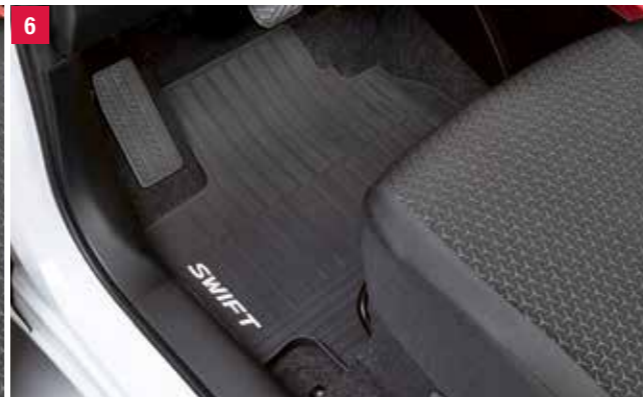
6 | Súprava gumených rohoží 1,2 So zvýšeným okrajom, na zvýšenie čistoty priestoru pre nohy, štvordielna súprava, pre vozidlá s manuálnou a automatickou prevodovkou. Obj. čís. 75901-52R11-000