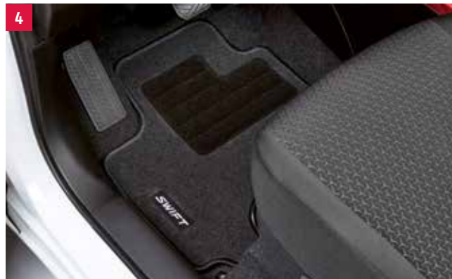
4 | Sada koberčekov „ECO“ 1,2 Antracitové plstené koberce so strieborným vyšívaným logom a čiernym lemovaním, štvordielna súprava, pre vozidlá s manuálnou a automatickou prevodovkou. Obj. čís. 75901-52RE1-000