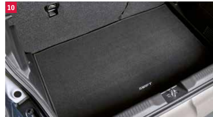
10 | Rohož do batožinového priestoru „ECO“ Antracitový plstený koberec so strieborným vyšívaným logom a čiernym lemovaním. Obj. čís. 990E0-53R40-000