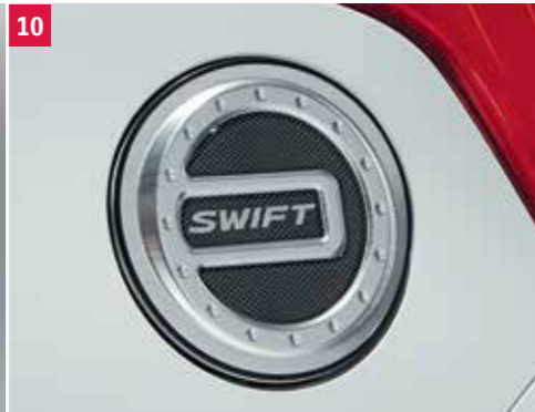
10 | Kryt uzáveru palivovej nádrže Embosovaný hliník s karbónovým dizajnom evotec a logom Swift. Obj. čís. 99237-53R01-000