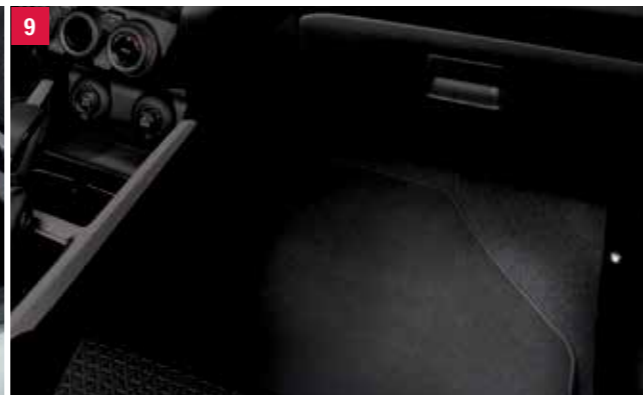
9 | Osvetlenie podlahy Biele osvetlenie LED, súprava pre predný a zadný priestor pre nohy, na ľavú a pravú stranu. Obj. čís. 99213-53R01-000