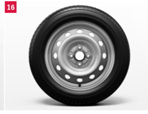
16 | Oceľový disk pre zimné pneu 15“ 2 Strieborná, oceľ, bez stredovej puklice. Obj. čís. 43210-52R20-000