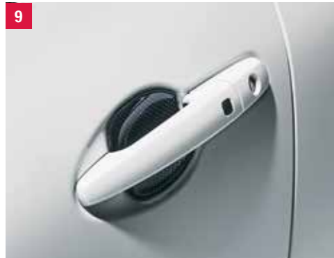
9 | Kryt pod kľučku dverí Dvojdielna sada, karbónový dizajn. Obj. čís. 99126-53R01-000