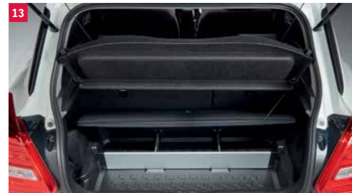
13 | Organizér do batožinového priestoru 3 Vanička s nastaviteľnými hliníkovými priečkami a vrchným krytom. Obj. čís. 990E0-53R21-000