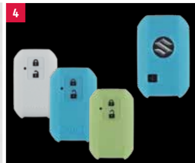
4 | Fluorescentný silikónový kryt na kľúč Svieti v tme následkom absorpcie svetla a kľúč chráni pred poškrábaním. K dispozícii v nasledujúcich farbách: White Obj. čís. 99000-79N12-377 Blue Obj. čís. 99000-79N12-378 Lime Green Obj. čís. 99000-79N12-379