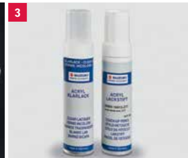
3 | Sada korekčných lakov K dispozícii v nasledujúcich farbách: Burning Red Pearl Metallic (ZWP) Obj. čís. 99000-10415-ZWP Speedy Blue Metallic (ZWG) Obj. čís. 99000-10415-ZWG Pure White Pearl (ZVR) Obj. čís. 99000-10415-ZVR Super Black Pearl (ZMV) Obj. čís. 99000-10415-ZMV Premium Silver Metallic (ZNC) Obj. čís. 99000-10415-ZNC Mineral Gray Metallic (ZMW) Obj. čís. 99000-10415-ZMW Fervent Red (ZNB) Obj. čís. 99000-10315-ZNB Flame Orange Pearl Metallic (ZWD) Obj. čís. 99000-10415-ZWD Rush Yellow Metallic (ZYK) Obj. čís. 9925D-B0100-ZYK