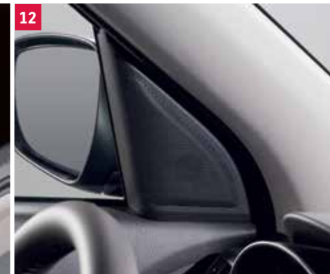
12 | SÚPRAVA VÝŠKOVÝCH REPRODUKTOROV Balenie obsahuje: - Výškový reproduktor - Súprava káblového zväzku - Kryt výškového reproduktora (L/P) Obj. čís. 990E0-53R18-000