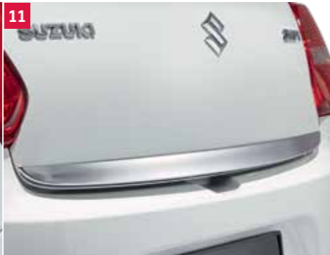
11 | Ozdobná lišta zadných dverí 1 Chrómový povrch Obj. čís. 990E0-53R22-000