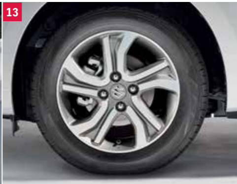
13 | Zimný disk kola z ľahkej zliatiny „COSMIC“ Sivá leštená metalíza, koleso z ľahkej zliatiny 5Jx15“ pre pneumatiky 175/65R15, stredová krytka s logom Suzuki. Obj. čís. 43210-52RS1-000