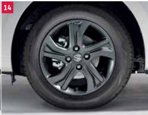
14 | Zimný disk kola z ľahkej zliatiny „COSMIC“ Matná antracitová mistral, koleso z ľahkej zliatiny 5Jx15“ pre pneumatiky 175/65R15, stredová krytka s logom Suzuki. Obj. čís. 43210-52RU1-000