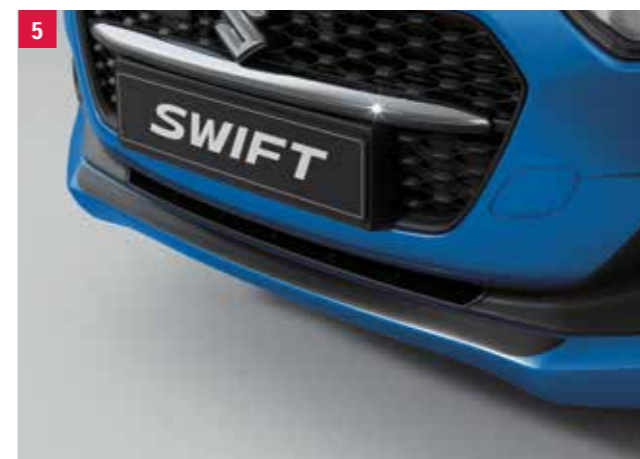
5 | Dekoratívny polep typu „lip“ na predný nárazník Jednodielný, karbónový dizajn. Obj. čís. 990E0-53R97-000

A : Referenčná značka sady. (Pozrite si stranu 1.) WVTA : Položka s touto značkou má certifikáciu WVTA.