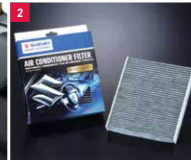
2 | Filter klimatizácie s deodorantom Odolný voči prachu, osviežuje vzduch a filtruje častice PM2.5. Obj. čís. 99250-53R01-000