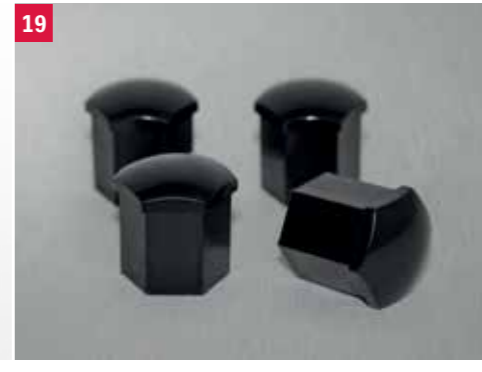
19 | Kryt skrutky kola Black Obj. čís. 990E0-62R70-COV