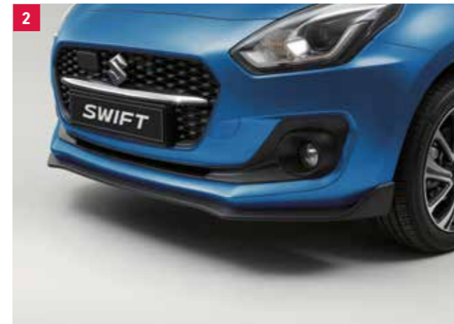
2 | Predný podspojler WVTA V štýle difúzora, karbónový dizajn. Obj. čís. 99111-53R00-000 C D E