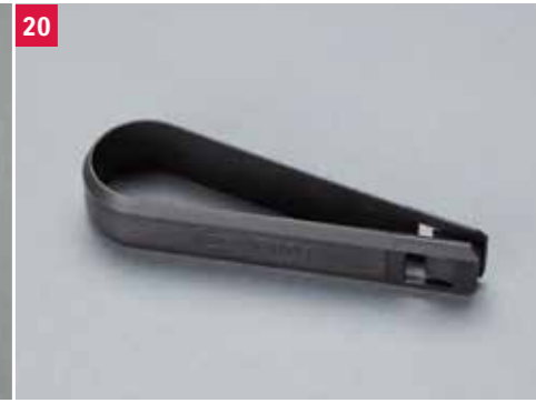
20 | Vytáhovací nástroj Pre KRYT SKRUTKY KOLESA (obj. čís. 990E0-62R70-COV). Obj. čís. 990E0-61M70-PUL