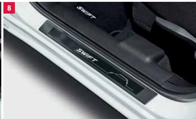
8 | Prahová lišta Čierna, s tlačným logom Swift, štvordielna súprava. Obj. čís. 990E0-53R60-001