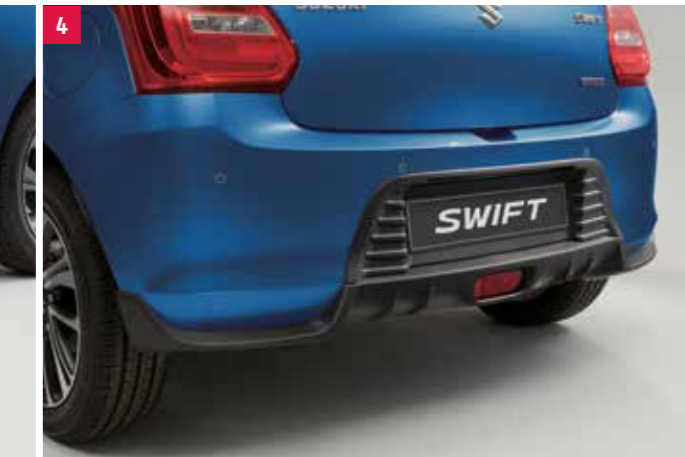
4 | Zadný podspojler WVTA V štýle difúzora, karbónový dizajn. Obj. čís. 99113-53R00-000 C D E