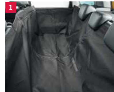
1 | Ochranný kryt na zadné sedadlá 1 Na čalúnenie zadných sedadiel. Obj. čís. 990E0-78R44-000