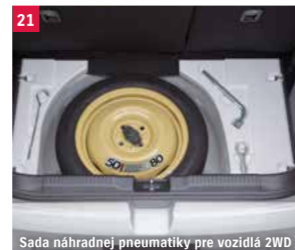
Sada náhradnej pneumatiky pre vozidlá 2WD