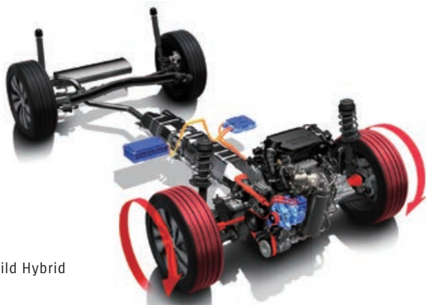
■ Mild Hybrid

Nový 48 V systém SHVS Mild Hybrid pozostáva zo 48 V ISG (integrovaného štartovacieho generátora) s funkciou elektromotora, 48 V lítiovo-iónovej batérie a 48–12 V meniča DC/DC. Vďaka zvýšenému prívodu napájacieho napätia v porovnaní s bežnými 12 V systémami sa zvyšuje množstvo energie rekuperovanej pri brzdení a zároveň miera asistencie elektromotora v záujme znižovania spotreby paliva a optimalizácie jazdného výkonu.